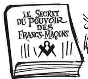
LE GROS TIRAGE