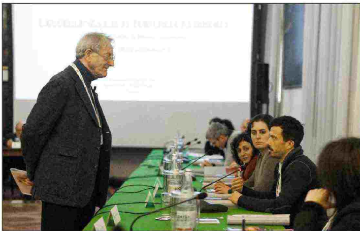
Un'immagine del Seminario di Perfezionamento 2014.

Assolutamente sì, perché quello del libraio è un mestiere bellissimo. È molto meglio del farmacista, per esempio: quello vende delle etichette, noi dei contenuti. Si tratta di un mestiere che non si fa per soldi ma ci si mette la vita dentro e la vita vale e si ricompensa due volte, perché ti permette di vivere vendendo una medicina straordinaria. Ogni libraio è un po' un medico o uno psicologo che per lavoro cerca di somministrare a ciascuno la medicina giusta: andiamo in libreria per cercare ciò che non sappiamo, non per trovare ciò che vogliamo.